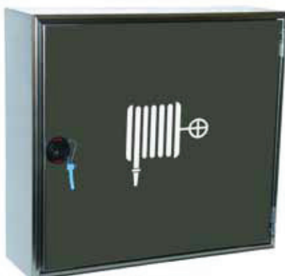
FLORIDA® INOX esterno con portello pieno.